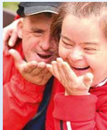
DET DANSKE GULD

Kom og vær med sammen med dine pårørende og venner til en hyggelig eftermiddag. Der vil være mulighed for at købe noget til at læske sig med, bl.a. øl, sodavand, kaffe, slushice, hjemmegrillede pølser og salg af amerikansk lotteri. Underholdningen vil i år udføres af DET DANSKE GULD