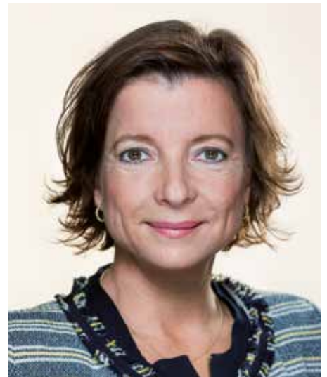
Socialminister Karen Ellemann.

misvisende. Kommunen har faktisk en pligt til at yde støtte og ledsagelse til udviklingshæmmede, der på grund af deres handicap ikke kan klare sig uden. Og den kommunale pligt omfatter også ferie, festivaler med videre. Det frem-