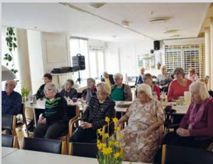
Så er der ældrebio.

alle Slagelse-borgere kan gå i anlægget og prøve nogle af dem i "Spil for sjov".