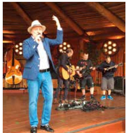
Flere billeder på side 11