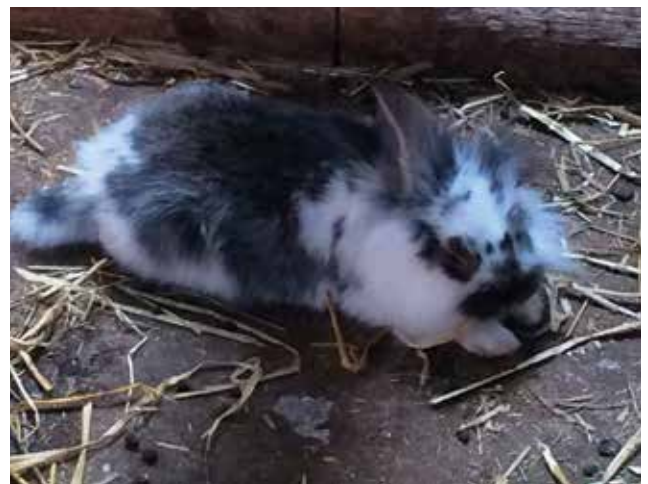
Flere billeder på side 7