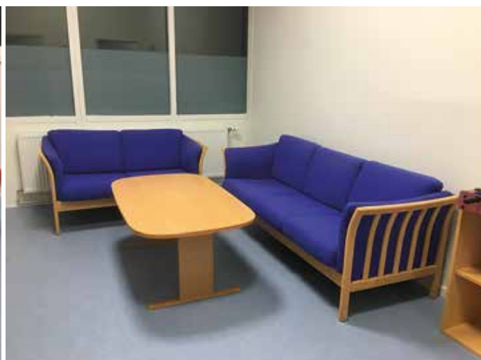
Lokaler til både spil, gaming, brætspil og hyggesnak samt lokaler til "stillerum" osv.