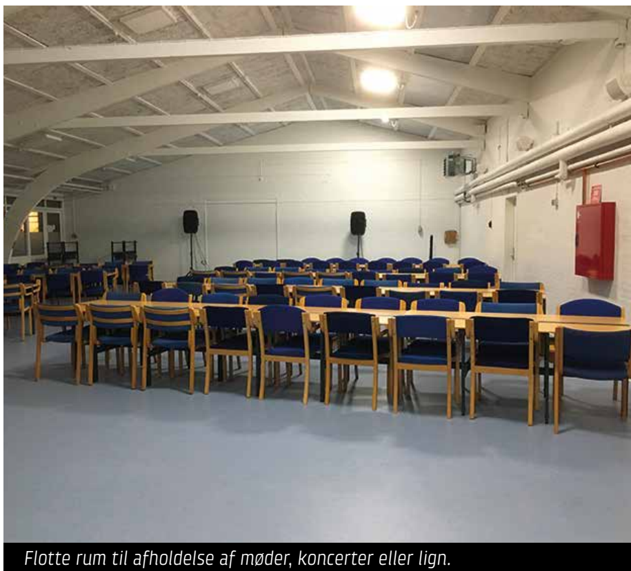
Flotte rum til afholdelse af møder, koncerter eller lign.

Vi har et gamer-rum med stort tv, dvd og PlayStation samt Wii.