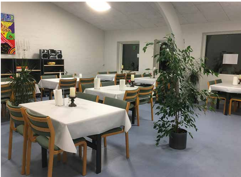
En lille café, hvor man kan købe lidt forskelligt.

Forskellige arrangementer og nye tiltag vil blive slået op på hjemmesiden og foldere vil blive delt ud til bosteder og beskyttede værksteder. Kig bare ind, vi viser gerne rundt.