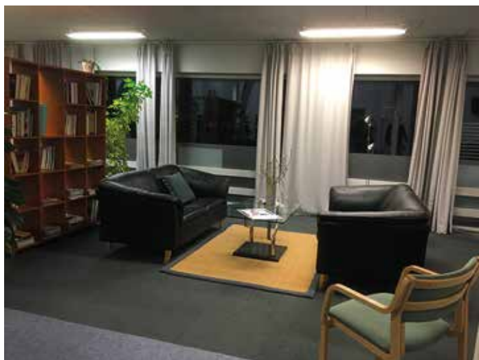
Et par af sofagrupperne.

Vi har fine mødelokaler i forskellige størrelser og en flot hal med plads til