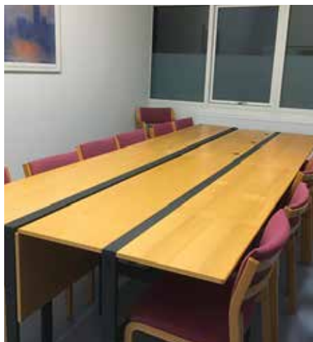
Her ses møderummet. Vi har også et "kreativt rum" og andre mødelokaler.