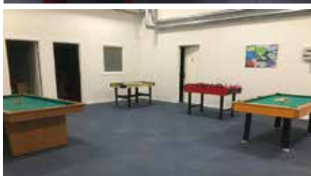
Vi har plads til mange forskellige aktiviteter. Kig forbi og se selv.

Kig ind i caféen eller sofagrupperne og få en snak med os, vi glæder os til at se og hilse på jer.