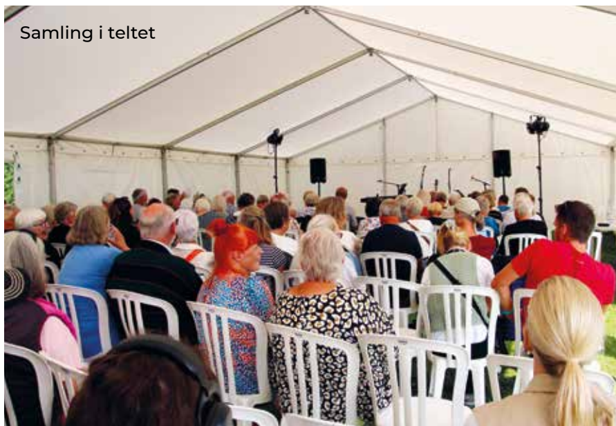
Samling i teltet