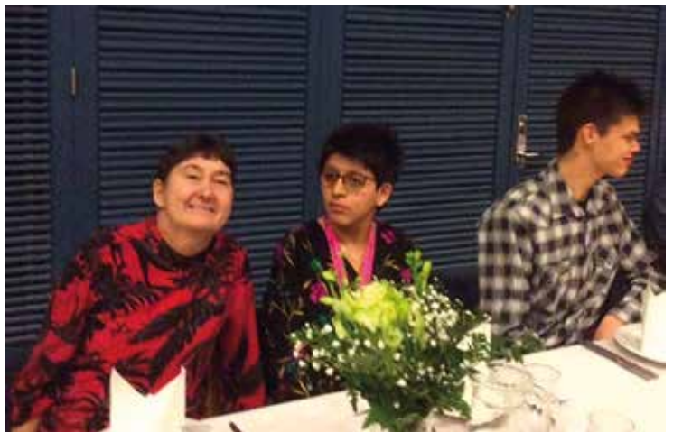
Flere fotos på næste side