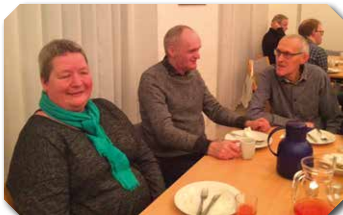
Flere fotos på næste side