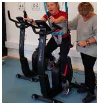
Cykling med hjælp af loftlift