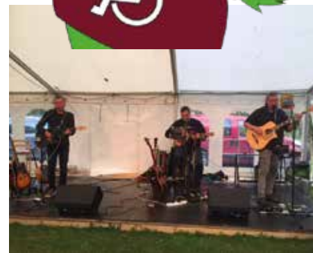
Det er et af de bands der spillede på festivalen om lørdagen.